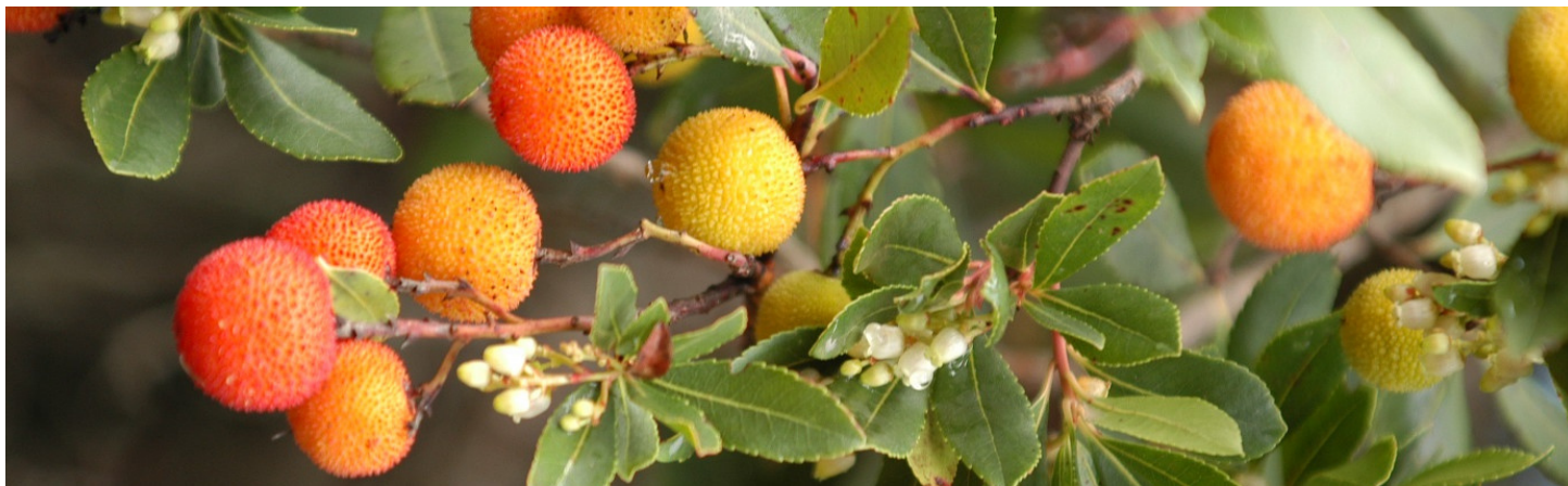
Corbezzolo (nome scientifico: Arbutus unedo ; nome sardo: lidone, olioni) con fiori e frutti. Tipico del paesaggio sardo settembrino, tingerà di rosso i boschi in autunno.